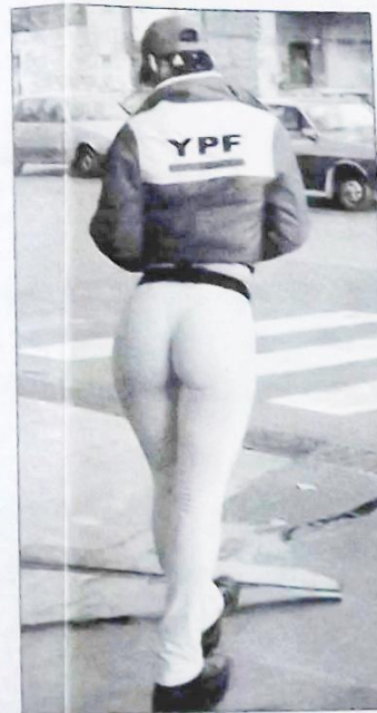
YFP. A manos del Estado argentino.

De Gucht ya había advertido en una carta enviada a Buenos Aires a fines de abril sobre "acciones bilaterales y multilaterales". La UE considera "so-